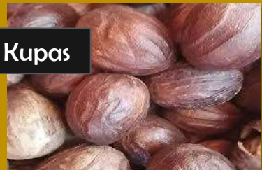
Pala belum Kupas

Pala merupakan tumbuhan berupa pohon yang berasal dari kepulauan Banda, Maluku. Akibat nilainya yang tinggi sebagai rempah-rempah, buah dan biji pala telah menjadi komoditas perdagangan yang penting sejak masa Romawi. Pala disebut-sebut dalam ensiklopedia karya Plinius "Si Tua". Wikipedia Buah pala memiliki banyak manfaat untuk berbagai macam industri. Mulai dari industri makanan, minuman, kosmetik, hingga obat-obatan. Buah pala dapat dimanfaatkan menjadi minyak angin, balsem, kopi, permen, dan sabun.