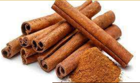
Kayu manis astor

Penghasil kayu manis terbesar di Indonesia adalah Kabupaten Kerinci merupakan penghasil kayu manis terbesar di Indonesia dengan total luas areal penanaman kayu manis