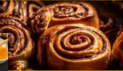
Untuk kue & minuman rempah