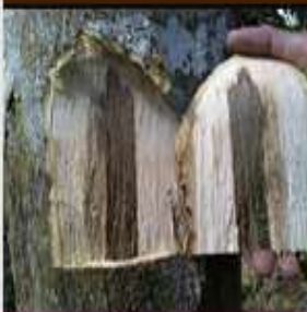
Gaharu Skin - Sumatera